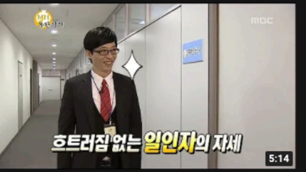
[무한도전] ((무한상사)) 우리 회사 아니에요...? 현실감 터지는 7인 7색 출근! 5:14 MBCentertainment 조회수 553만회 · 9년 전