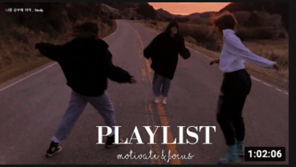
Playlist 1:02:06 🔥 Playlist 🔥 이런 팝송은 대체 어떻게 찾아? 주인장 선곡 센스 믿고 들어오세요 나랑 공부해 쉬어, Study 조회수 27만회 · 3주 전