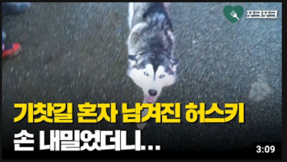
기차길 혼자 남겨진 huski 손 내밀었더니... 3:09 🍴 기차길 배회하는 huski 발견한 소방관의 조치 포크포크 조회수 711만회 · 1년 전