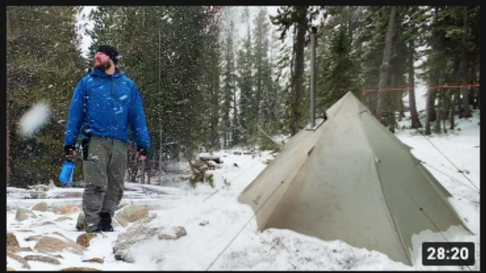
눈보라에 뜨거운 텐트 캠핑 | 우드 스토브 비프 스트로가노프 28:20 Hike Camp Climb 조회수 414만회 · 1개월 전