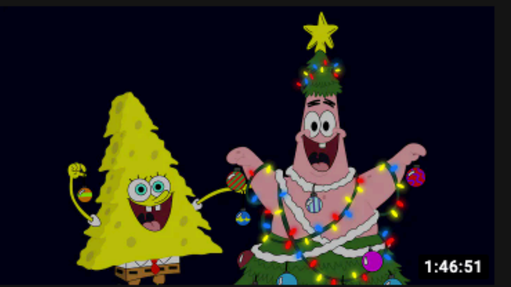
틀어놓으면 100분은 아무 걱정없잖아. 감성힙합 Playlist 1:46:51 힙합힙합 조회수 105만회 · 2주 전