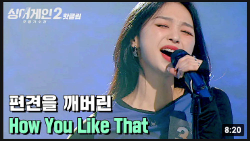
How You Like That 8:20 🔥 핫클립 🔥 "쌤이 왜 여기서?" 오디션프로 애청자들은 다 아는 실력자 31호 가수 'How...' JTBC Voyage 조회수 156만회 · 1일 전