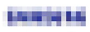
인턴 2 (2021/07 ~ 2021/08)