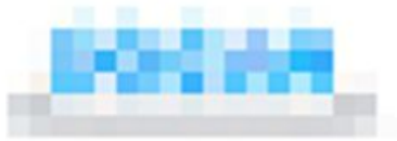
학점연계 (2021/03 ~ 2021/06)