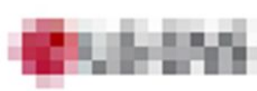
인턴 3 (2021/11 ~ 2021/12)