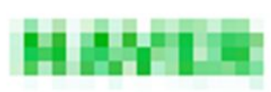
정규직 신입 (2021/12 ~ )